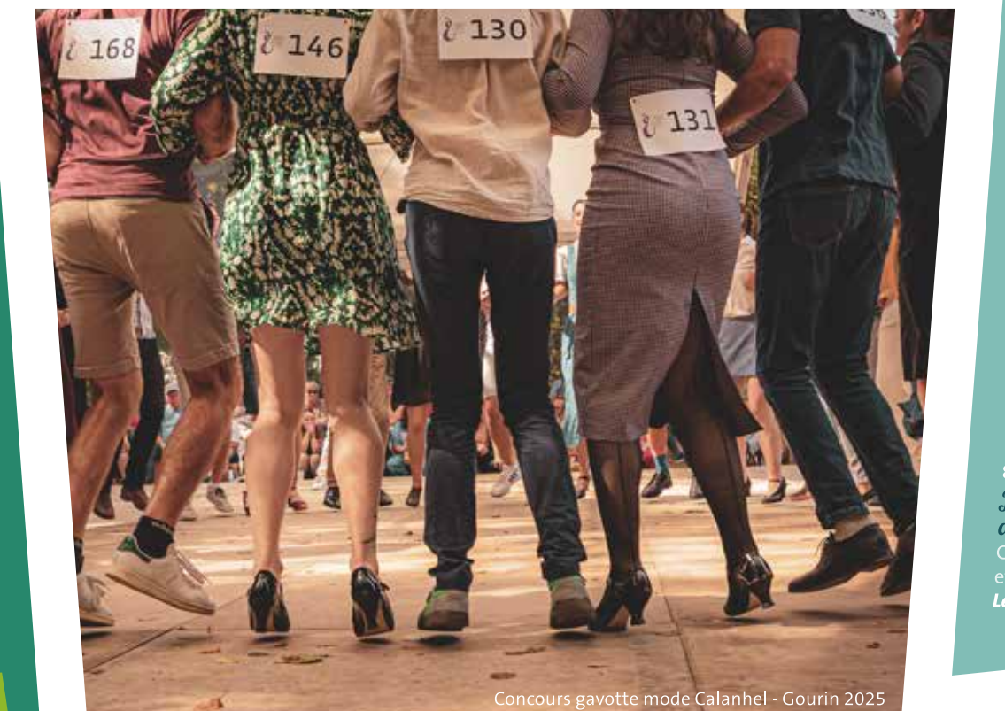
Concours gavotte mode Calanhel - Gourin 2025