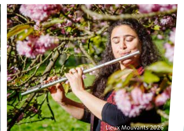
Lieux Mouvants 2026