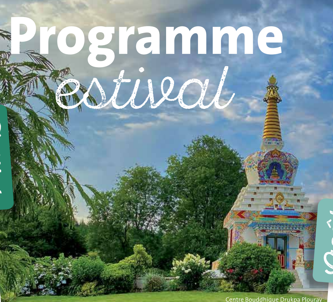
Centre Bouddhique Drukpa Plouray