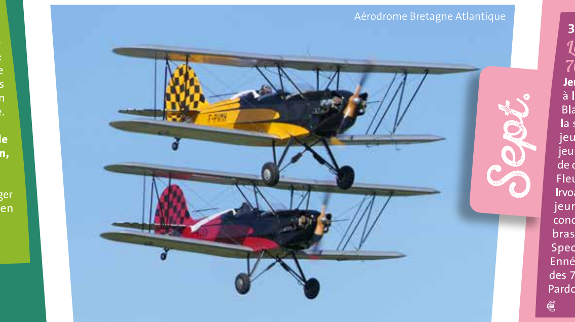
Aérodrome Bretagne Atlantique