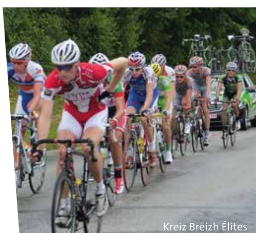
Kreiz Breizh Élites